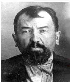
Imagen 1. Stanislav Petrovsky, primer embajador de Unión Soviética en México, 1924–1926

El primer embajador en México fue Stanislav Petrovski, 9 un conocido revolucionario con mucha experiencia. En noviembre de 1924 presenta sus credenciales al gobierno mexicano y aparentemente todo comienza muy bien pero Petrovski, es al mismo tiempo un agente de la Internacional Comunista que empieza a tener injerencia en la vida política mexicana. En este tiempo la embajada rusa se había convertido en la sede del Partido Comunista. Esta situación empezó a crear roces y declaraciones desafortunadas que se malinterpretaron como que México era un bastión para la expansión del comunismo en el continente. Petrovski, en 1926, regresa a Rusia y en su lugar llega Alexandra Kollontai, primera mujer embajadora en el mundo, que promueve contactos culturales en lugar de las intervenciones políticas (Ortiz, 2012).